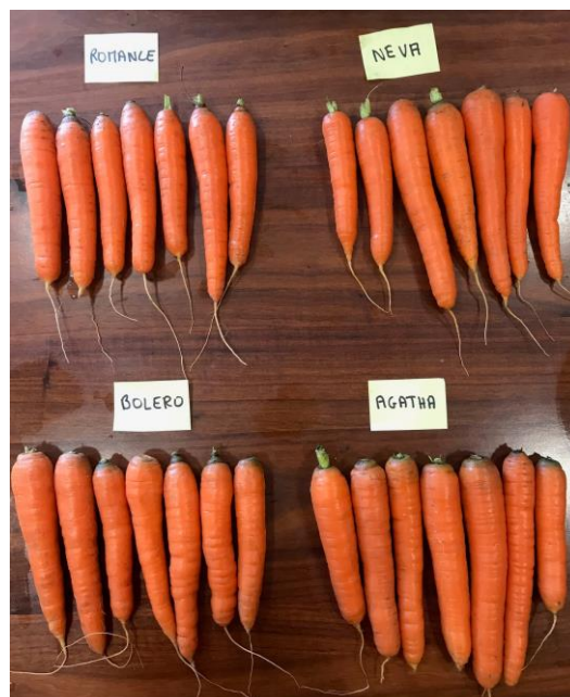
Figure 1 : Carottes au stade récolte

L'ensemble des carottes présentent un léger collet vert.